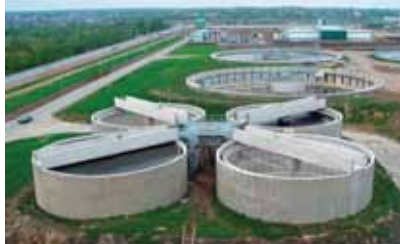
Tanques de Agua Potable y Residual